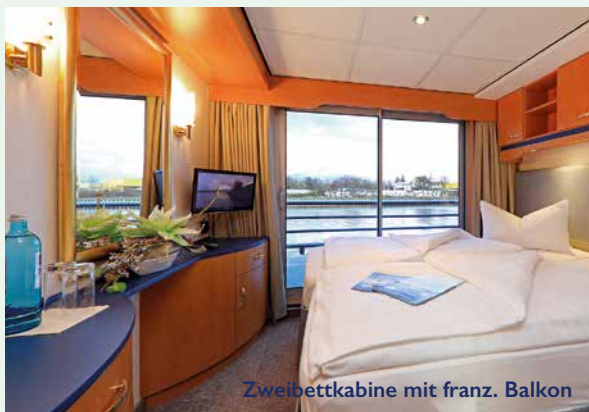
Zweibettkabine mit franz. Balkon